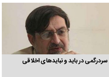
سردرگمی در باید و نبایدهای اخلاقی