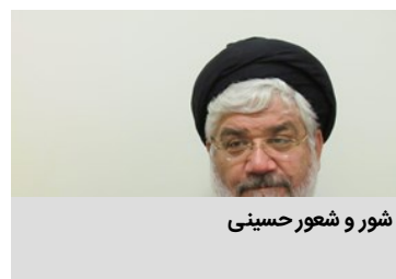
شور و شعور حسینی