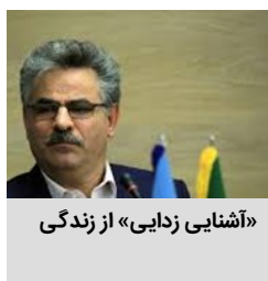
«آشنایی زدایی» از زندگی