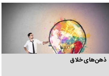
ذهن های خلاق